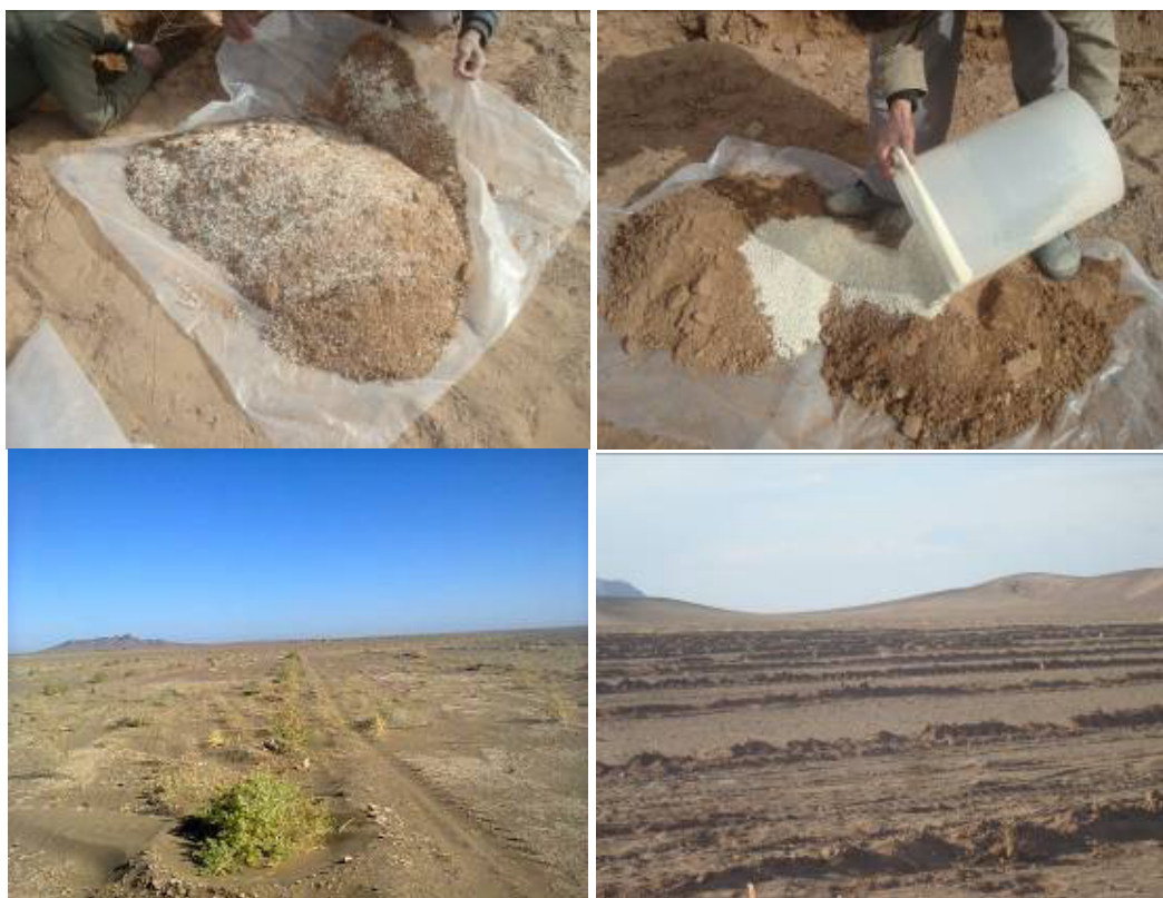
شکل ۱- آماده‌سازی خاک و کاشت نهال‌ها در عرصه

در دو سطح آبیاری معمول در منطقه و کم آبیاری انجام گرفت. فواصل آبیاری در طرح‌های نهال‌کاری رایج در منطقه، ۳۰ روز یک‌بار در فصول بهار و تابستان دو سال اول کاشت می‌باشد. در پروژه حاضر بخشی از نهال‌ها که تحت تیمار آبیاری معمولی قرار داشتند هر ۳۰ روز یک‌بار