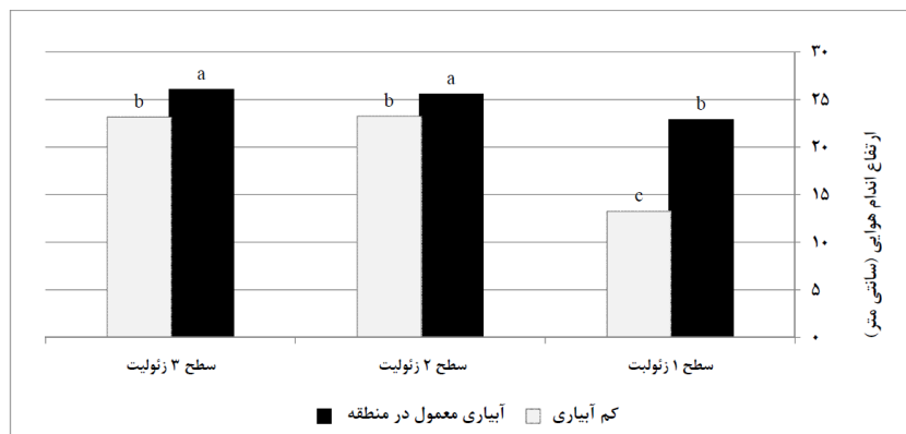
شکل ۳- اثر متقابل دور آبیاری و سطح ماده بر ارتفاع نهال‌ها

نتایج حاصل از مقایسه میانگین تأثیر متقابل عوامل سطح آبیاری و سطح ماده بر ارتفاع گیاهان (شکل ۳) نشان می‌دهد، ارتفاع اندام هوایی در تیمارهای حاوی ۱۰ و ۱۵ درصد وزنی زئولیت و شرایط کم آبیاری با هم اختلاف معنی‌دار نداشت. همچنین این تیمارها با تیمار شاهد